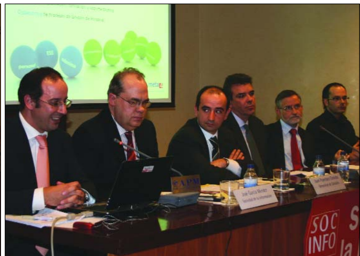
Vista general de la primera (izquierda) y segunda mesa de ponentes.