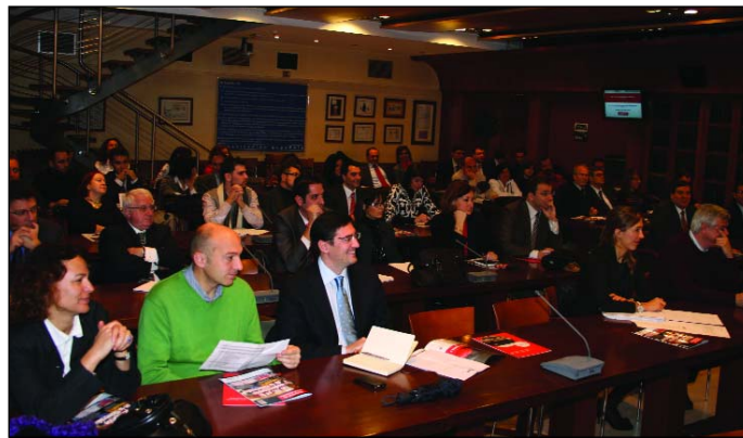
Aspecto parcial del público asistente.